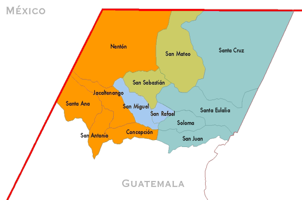
Le continuum dialectal q'anjob'alien

q'anjob'aliennes ont été parmi les plus étudiées des langues mayas et sont dotées de solides monographies (Zavala 1992 pour l'akatek, Craig 1977 pour le popti', OKMA 2000). Leur dialectique de continuité et diversité a fait l'objet d'un célèbre article de Terrence Kaufman (1976), avec son plaisant et retentissant « une langue ou quatre langues, mais ni deux ni trois », qui a eu des conséquences sur l'élaboration de la carte officielle des langues mayas du Guatemala dans les années 1990, tant pour le q'anjob'al que pour les langues quichéanes, à la suite d'un précédent tout aussi retentissant pour la diversité du domaine maméan (cf. Kaufman 1969). Cette contribution a permis de voir que le continuum dialectal q'anjob'alien, qu'on peut considérer comme un carrefour typologique des langues mayas, s'avère un observatoire heuristique pour une synergie entre dialectologie et typologie linguistique, notamment phonologique (Léonard & dell'Aquila, 2009).